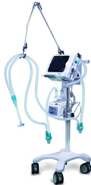
エアインテークフィルタ (HEPA) T60 129 23 260