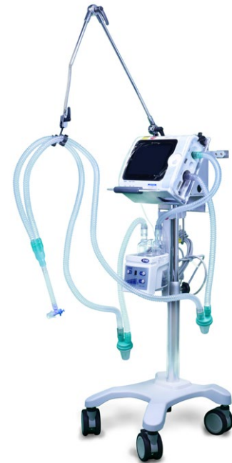
エアインタークフィルタ (HEPA) T60 129 23 260